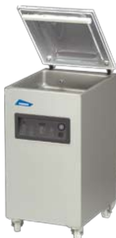
Marlin 42 XL